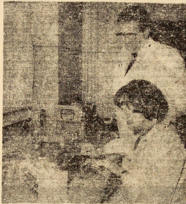
Aspect de muncă din cadrul laboratorului de conservare și recoltare a șingelui din Petroșani.