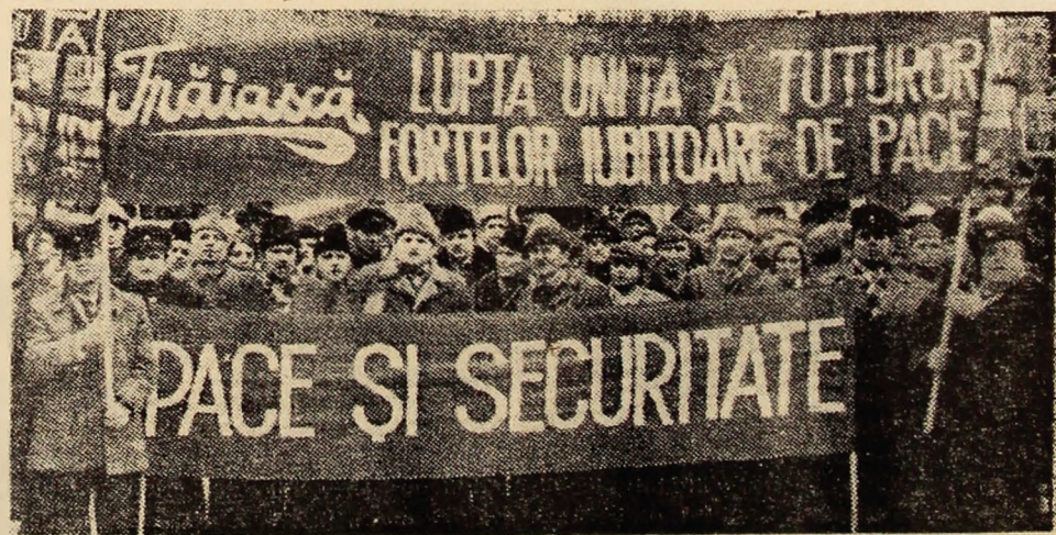
Reprezentanții oamenilor muncii din Valea Jiului la marea adunare publică de la Deva au exprimat dorința fermă a colectivelor noastre de a trăi în pace, de a munci pentru dezvoltarea economico-socială a județului, pentru înflorirea scumpei noastre patrii.