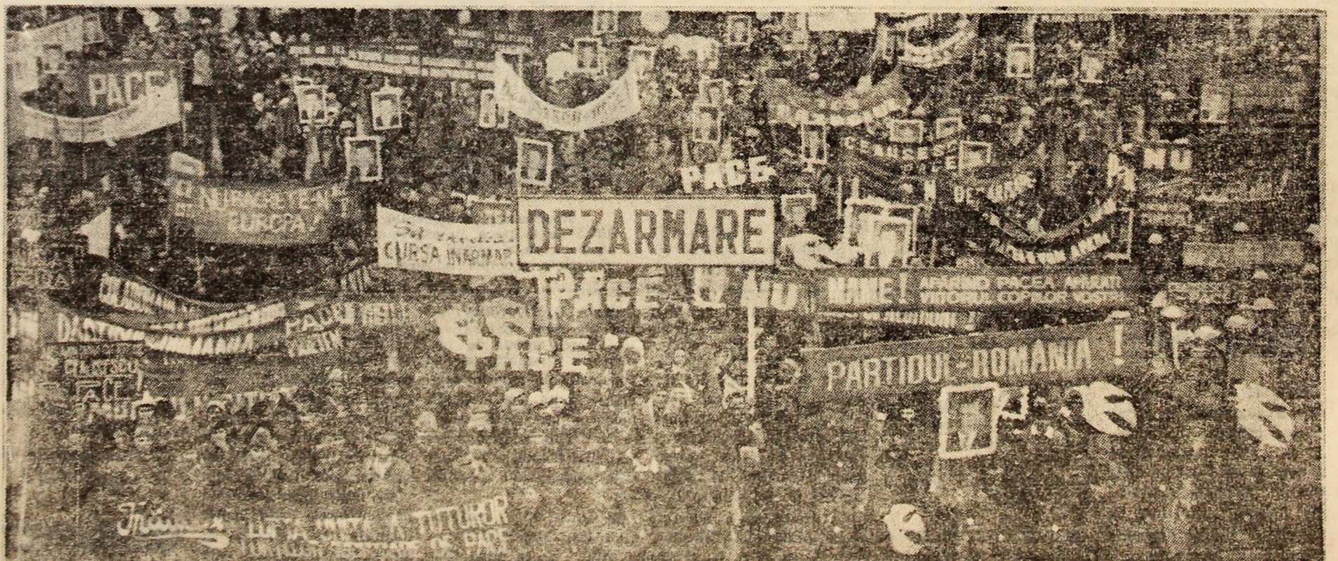
Aspect din timpul desfășurării marii adunări publice pentru dezarmare și pace, a oamenilor muncii din județul Hunedoara.