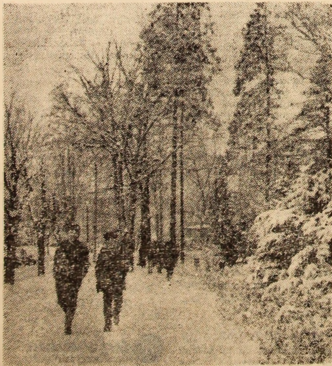
Insorită zi de iarnă