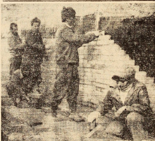
Paralel cu înălțarea halilor de producție pe șantierul întreprinderii de fire celulozice tip „Viscoza” din Lupeni, se lucrează la amenajări speciale. În imagine, se lucrează la captusirea cu cărămidă anticacidă, a unei băi dintr-una din viitoarele secții de producție.

Problema care se pune în mod deosebit în această situație o constituie finalizarea acelor lucrări de care depinde asigurarea în cel mai scurt timp a frontului pentru montaje. Dar cel puțin la fel de importante sînt și construirea liniei ferate uzinale, a adăpostului subteran necesar gospodăririi combustibilului. Fără acestea nu se poate asigura calitatea și cantitățile de combustibil necesare celor două cazane de abur-forță de care depinde atât calitatea firelor produse la I.F.A. „Viscoza”, cât și livrarea agentului termic la un alt important obiectiv de investiții industriale de aici — Tesătoria de mătase, care în curând va fi dată în funcțiune.