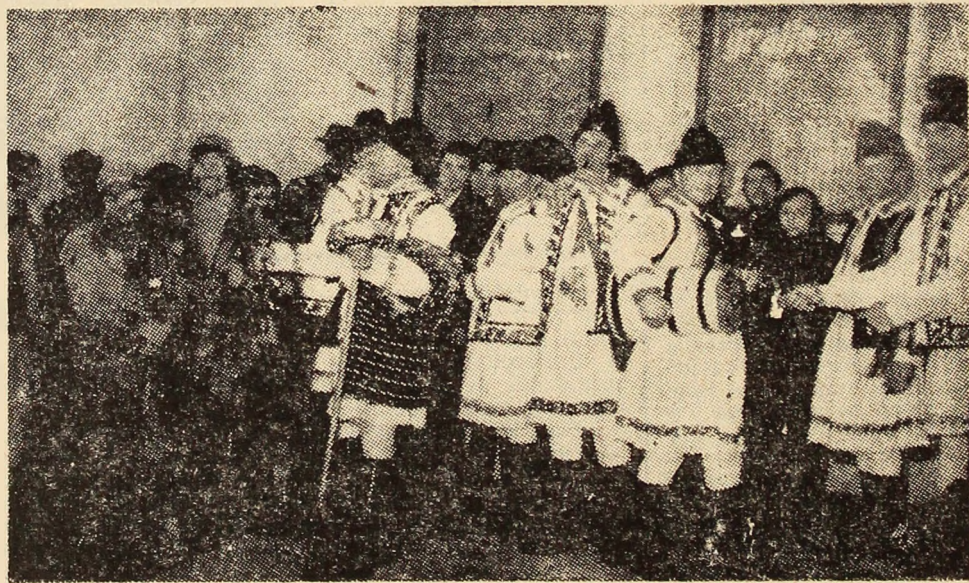
Colindătorii în mijlocul minerilor de la Livezeni.