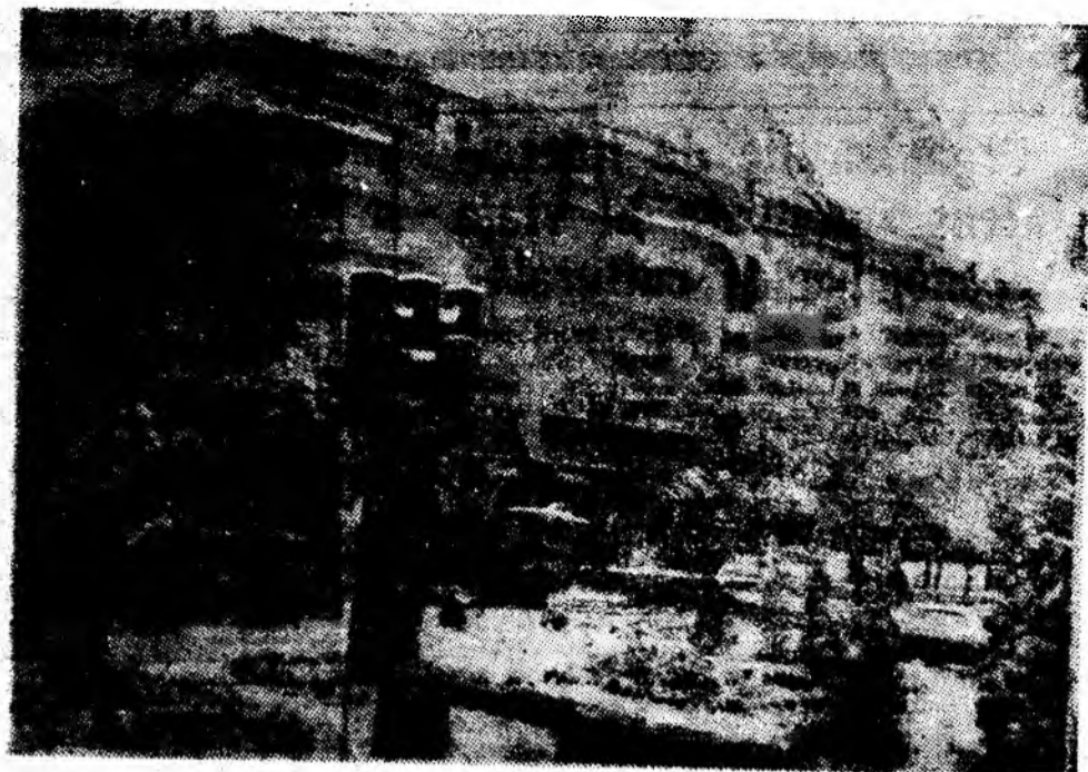
După primele zile ale acestui an, zăpada a învăluit din nou localitățile Văii Jiului cu manta ei albă, dovedindu-ne că iarna este încă în drepturile sale depline.