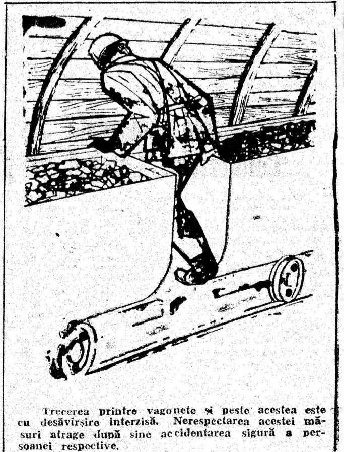
Trecerea printru vagonete și peste acestea este cu desăvîrșire interzisă. Nerespectarea acestei măsuri atrage după sine accidentarea sigură a persoanei respective.