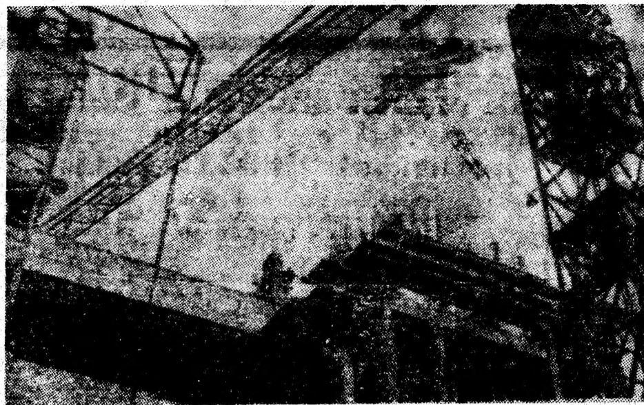
Construcții viitorului magazin universal din Petroșani lucrează la cota finală a clădirii.