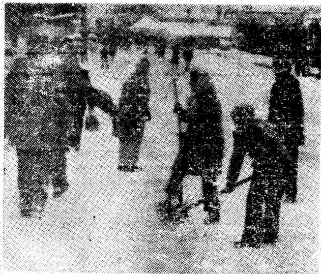
Din nou zăpadă, din nou trotuarele reclamă acțiuni de deszăpezire din partea gospodariilor.