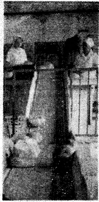
Pe fluxul tehnologic de fabricație de la Fabrica de piine Livezeni.