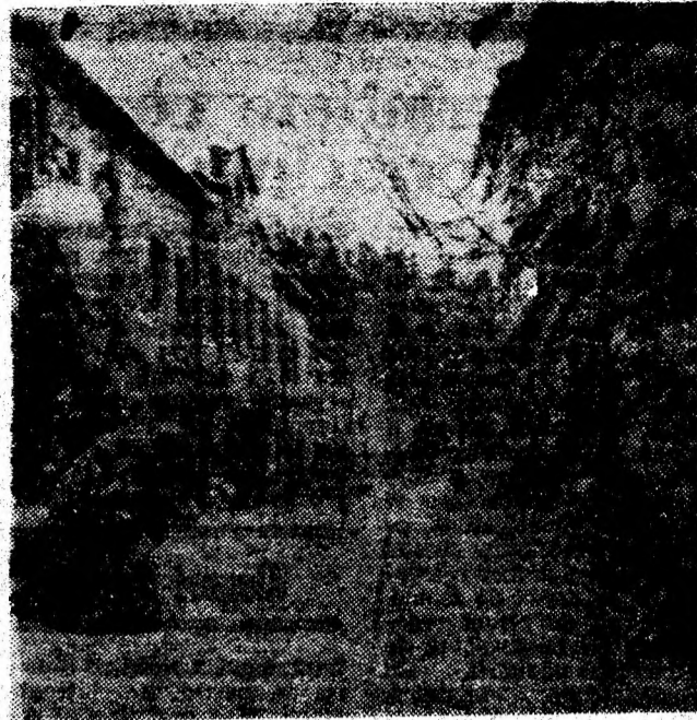
Iarna este încă în drepturile sale depline și pe dealul Institutului de mine din Petroșani.