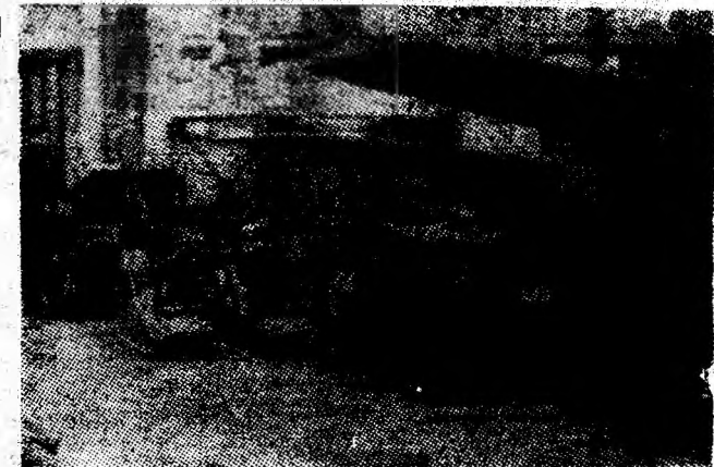
Imaginea de față surprinde hala I.U.M. Petroșani în care sînt asamblate complexele mecanizate de abataj — utilaje de înaltă tehnicitate și cu parametri ridicați ai căror beneficiari sînt minerii din bazin.