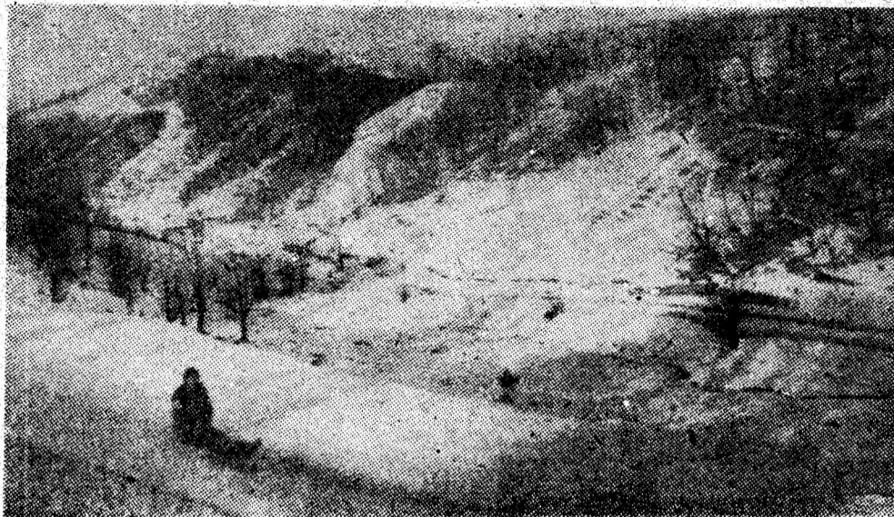
Imagine devenită clasică în acest sezon: turistul la schi și sănîș.