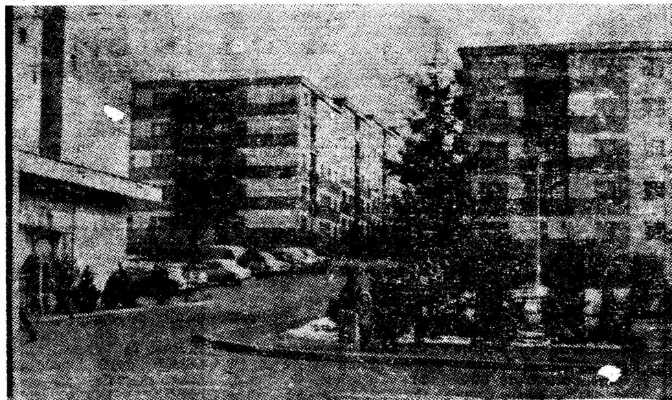
Mii de oameni ai muncii din Valea Jiului beneficiază, împreună cu familiile lor, de condiții minunate de locuit. Noile cartiere din orașele Văii Jiului sînt o dovadă grăitoare a grijii permanente a partidului pentru om și nevoile sale. În imagine — noi blocuri de locuințe în Petroșani.

durile din zona Cheveresu Mare, județul Timis. Tovarășii Nicolae Ceaușescu și Dușan Dragosavaț au luat, apoi, parte la un dejun vînătoresc.