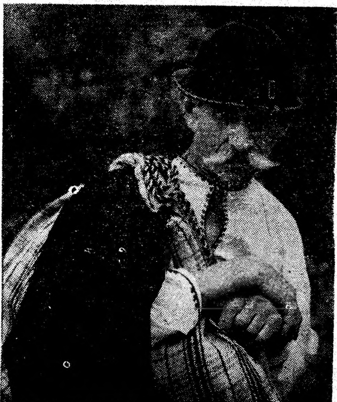
„Neîncredere”, lucrare expusă în prezent în orașele Spaniei.