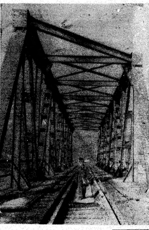
„Oare așa o fi arătînd... Tunelul timpului”

Era atît de mic încît trebuia să stau în genunchi în fața lui. ★ O statuie din aur masiv, intitulată „sărăcie”. ★ Întii trebuie să fi apărut banul. Abia pe urmă oamenii de valoare. ★ Reumatism. Pe Matusalem îi dureau genunchii la fiecare schimbare de epocă. ★ Cînd s-a rupt firul marioneta a căzut grămădă. A fost primul ei gest independent.