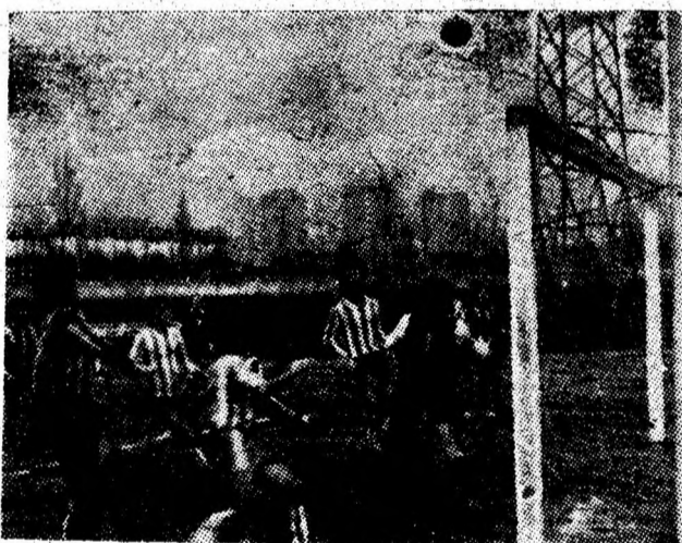
O fază de atac a echipei minerilor din Paroșeni irosită în fața porții.