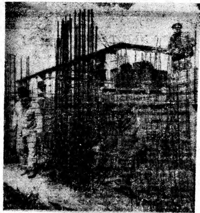
În zona noului centru civic din Vulcan a început construcția unui nou bloc cu opt nivele și spații comerciale la parter. În imagine, echipa de dulgheri condusă de Nicolae Pălimaru montează scheletul metalic în vederea turnării betoanelor la temelia blocului.