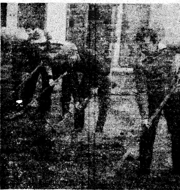
Locatarii blocului 17 din zona noului centru civic al Vulcanului au venit în primăvara constructorilor.