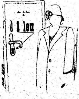
Desen de Mihai BARBU

O firmă australiană a construit o bicicletă amfibiă. Roțile ei din spate au cauciucuri și camere foarte umflate, asigurînd plutirea. Pe spițele lor sint montate palete, care constituie dispozitivul de propulsare. Roata din față asigură — prin manevrarea ghidonului — direcția de mers a năstrușnicului vehicul.