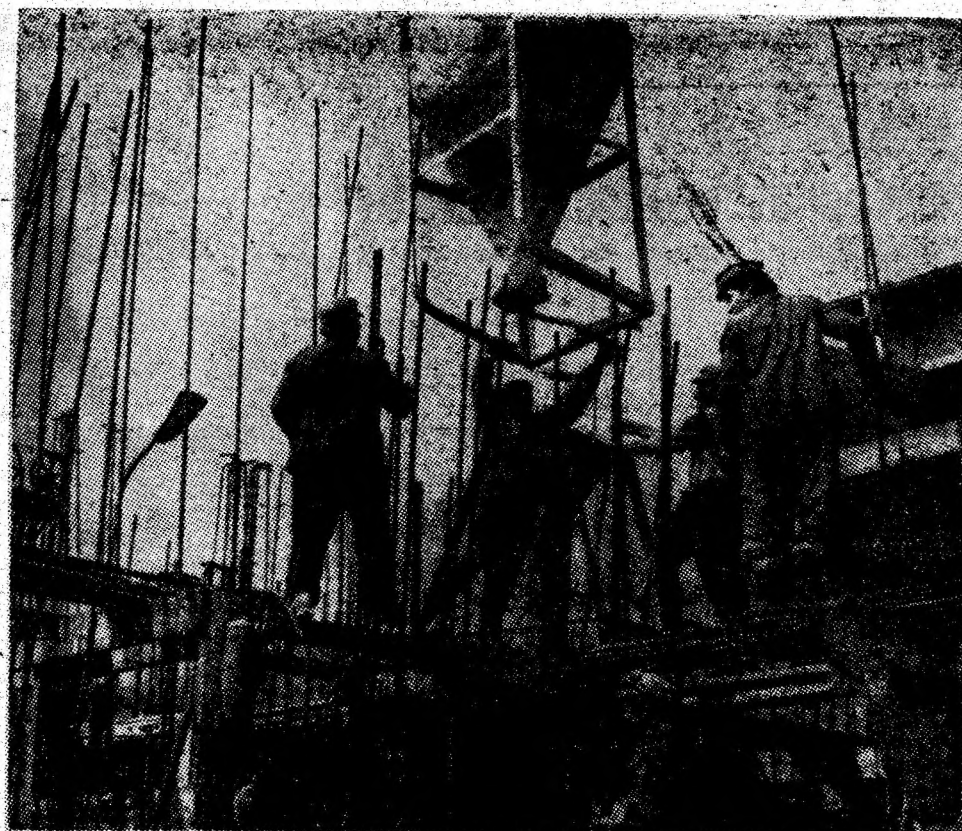
În toate localitățile Văii Jiului se înalță noi și moderne obiective social-culturale ce schimbă înfățișarea orașelor noastre. În imagine un aspect de muncă de pe șantierul construcțiilor de locuințe din Lupeni.