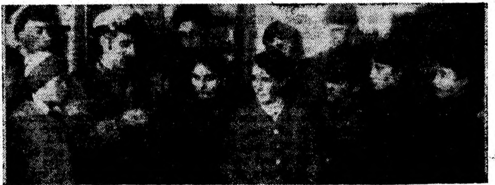
Oră de practică la Școala generală Iscroni.

CU DEFECTIUNI TEHNICE. Deși verificarea tehnică anuală era făcută,