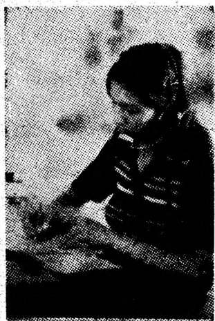
La serviciul de informații 03 de la centrala telefonică a P.T.T.R. Petroșani se primesc răspunsuri prompte.