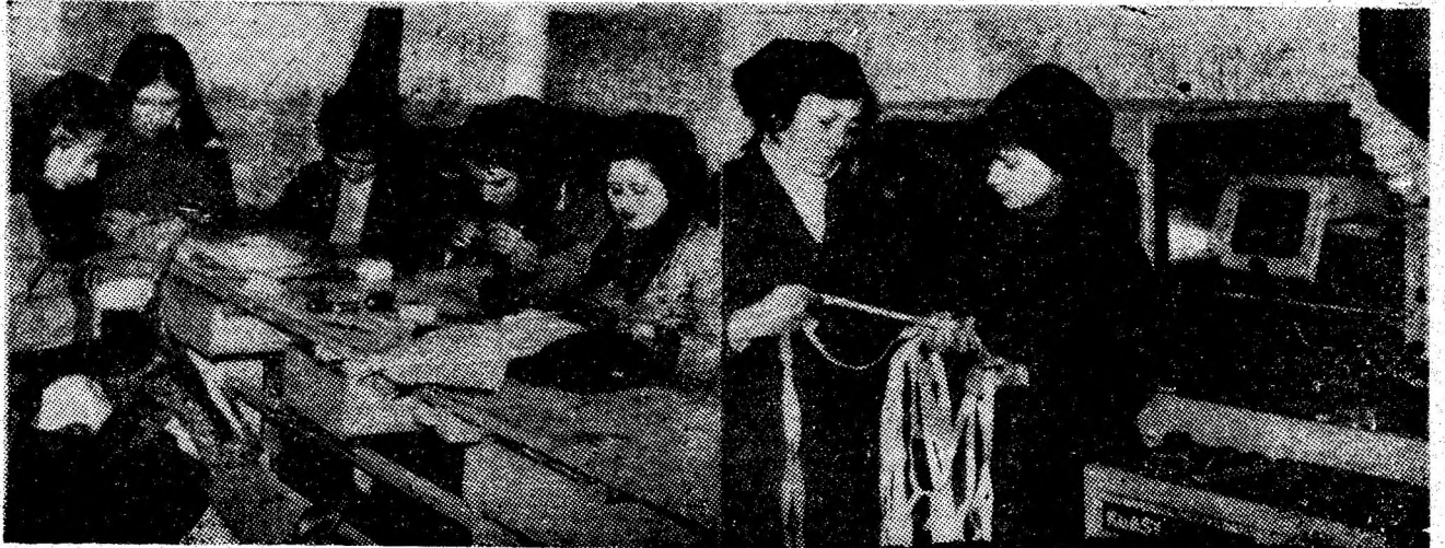
În atelierul cooperativei o atenție deosebită este acordată calității lucrărilor și încadrării în termenele planificate. Așa este păstrat renumele colectivului printre beneficiarii din localitate.