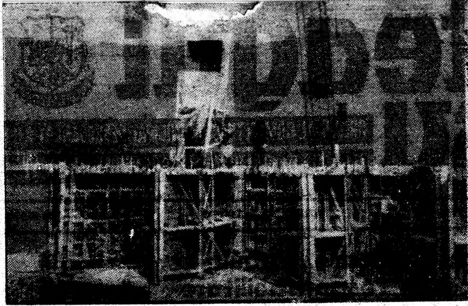
Constructorii șantierului nr. 1 Petrița al I.C.M.M. lucrează la definitivarea unui nivel al unui complex de garsoniere.