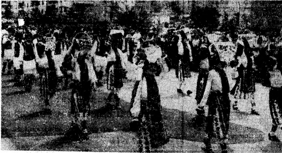
Parada portului popular pe Bulevardul Victoriei din Vulcan, desfășurată la ediția din anul trecut a „Nedeii vulcâneane”.

— Va avea loc tragera la tombola „Costești '82”, organizată de Comitetul județean Hunedoara al U.T.C. Cei 19 000 de tineri din Valea Jiului, posesori de bilete la tombolă, au șansa câștigării unor obiecte de reală utilitate — motoretă „Mobra”, magnetofon, televizor portabil tip „Sport”, echipament sportiv etc.