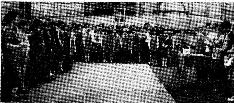
Cu interes, elevii Școlii generate nr. 4 din Petrosani au luat cunoștință de conținutul Apelului poporului român adresat sesiunii speciale a O.N.U., susținînd noua inițiativă de pace a României socialiste.

rii. Întrunite într-un însuflețit miting pentru pace, în hala secției de confecții, confecționere, tricotoare, și alți oameni ai muncii și-au exprimat voința fermă: „Avem nevoie de pace, de certitudinea zilei de mâine și de aceea ne pronunțăm pentru dezarmare, pentru o Europă fără arme nucleare, pentru o lume a păcii”. În cadrul