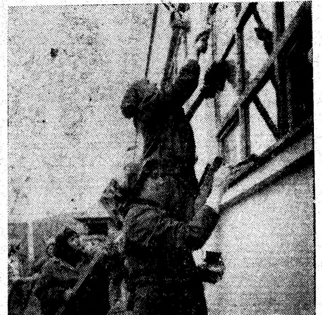
La secția Petroșani a I.P.L. Deva muncitoarele fac toaleta exterioră a clădirii secției, cu priceperea și dragostea cu care asigură frumusețea mobilei.