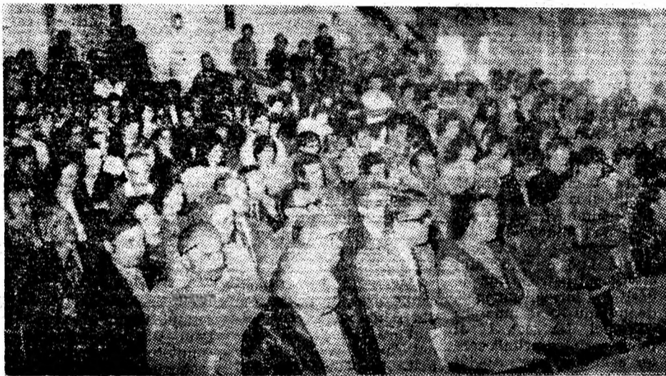
Aspect de la mitingul de pace al cadrelor didactice și studenților Institutului de mine din Petroșani.

Moțiunea a fost adoptată în unanimitate de participanții la miting. (Toma TAȚARCA).