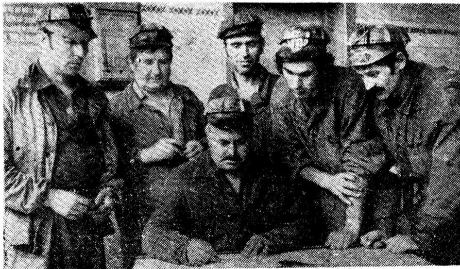
Minerii de la Petrila semnînd Apelul pentru dezarmare și pace.