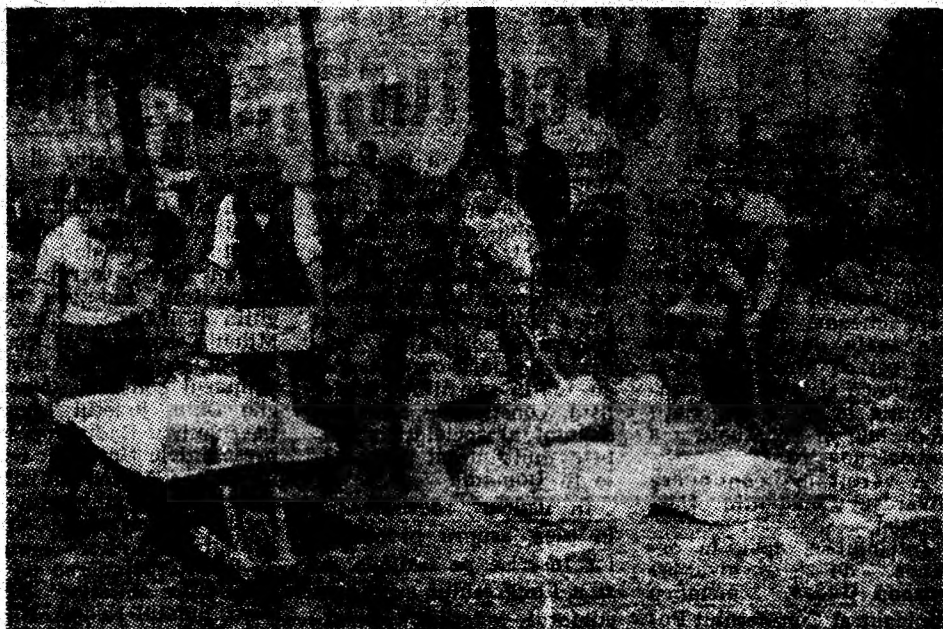
Se lucrează în ritm susținut la modernizarea străzii N. Bălcescu din Petroșani.