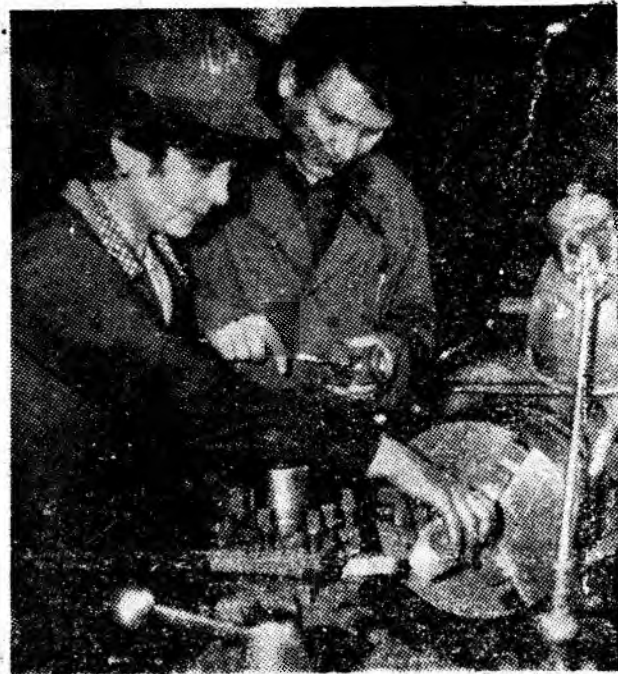
În atelierul de automatizări I.U.M.P.