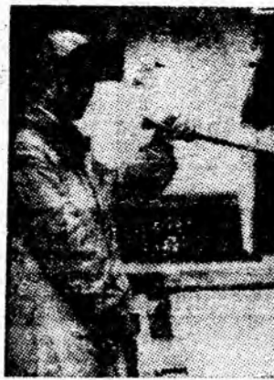
Fabrica de mobilă Petrila. Femeile își dovedesc competența profesională.

Preluările ce au loc la termenele stabilite la fiecare loc de muncă, probele de sist care se fac zilnic, precum și numeroasele controale efectuate în subteran dezbăuie atitudinii contrarii privind ac-