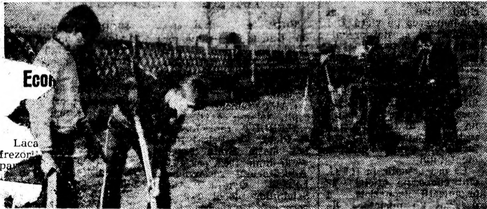
În cadrul acțiunilor gospodărești, plantări de pomi în zona Livezeni.

În ansamblul muncii desfășurate, o contribuție însemnată la obținerea acestor rezultate au adus organizațiile de pionieri și U.T.C. care, sub direcția îndrumare a organizațiilor de partid, și-au organizat activitățile pentru canalizarea eforturilor spre educația tinerii generații în spiritul dragostei față de patrie, a respectului față de munca productivă, în spiritul respectării normelor eticii și echității socialiste. Hotărîrea slujitorilor școlii este de a obține rezultate superioare în toate compartimentele procesului instructiv-educativ, așa cum ne cere secretarul general al partidului. Condițiile create ne dau convingerea că noul an școlar va marca un important salt calitativ în toate laturile activității noastre, dînd astfel răspuns, prin fapte, îndemnurilor adresate, de la tribuna recentului Congres, de secretarul general al partidului, tovarășul Nicolae Ceaușescu, părintele iubit al tineretului școlar.