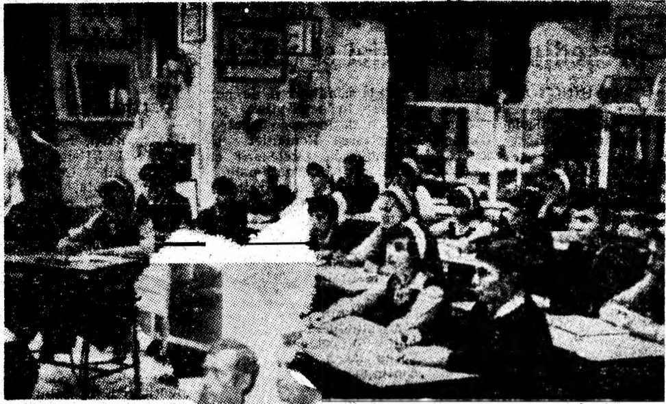
Oră de curs în modernul cabinet de organe de mașini de la Liceul industrial minier Petroșani.