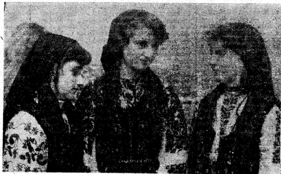
Trei fete... cucuiete.