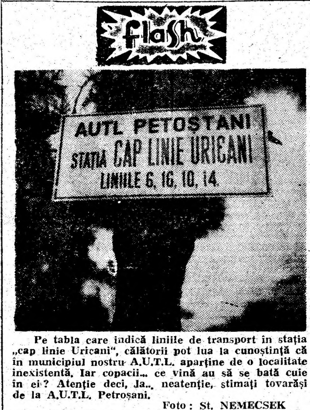
Pe tabla care indică liniile de transport în stația „cap linie Uricani”, călătorii pot lua la cunoștință că în municipiul nostru A.U.T.L. aparține de o localitate inexistentă, iar copacii... ce vină au să se bată cuie în ei? Atenție deci, Ja., neatenție, stimați tovarăși de la A.U.T.L. Petroșani.

Concluzionînd, calitatea muncii impune cu necesitate pregătire superioară, dar mai ales conștiință muncitorească. Chiar dacă succesele nu sînt spectaculoase în procente, ele au un rezultat reflex în subteran, oferă siguranță exploatații straturilor. Deci activitate cotidiană fără spectaculos, dar în care copleșitoare apare ideea de abnegație, de promptitudine, de rezolvare a tuturor sarcinilor încredințate, măcar cu o zi mai devreme.