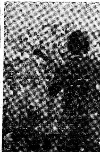
Formația de artiști vocal-instrumentali a bazei de agrement „La brazi”.

Locul de agrement „La Brazi” din Vulcan a cunoscut, duminică, 8 august, o animație deosebită. Profitînd de timpul frumos care se anunțase de dimineață, sute de locuitori s-au îndreptat, încă înainte de ora 10, spre baza de agrement a orașului. Și, într-adevăr, n-au regretat că au făcut acest drum! Totul a fost la înălțime. Unitățile de alimentație publică din Vulcan, fiecare avînd cîte 4-5 puncte de desfacere, au pus la dispoziția minerilor, preparatorilor, energeticienilor și celorlalți oameni ai muncii peste 25 000 mici, grătare, pui, cremvurști, 83 000 sticle de bere și răcoritoare. Pe estrada amenajată în aer liber s-au perindat formațiile de artiști amatori ale clubului sindicatelor din localitate. Am aplaudat și noi, alături de ceilalți spectatori, evoluția fanfarei minerilor, orchestrei și soliștilor de muzică populară și a for-