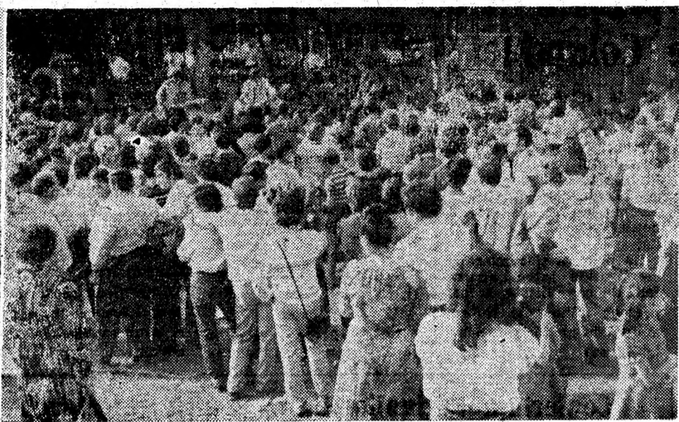
ale clubului sindicatelor din Vulcan au oferit minerilor, preparatorilor și energeticienilor, veniți în număr mare la e programe artistice care au contribuit la întregirea atmosferei de bună dispoziție ce a domnit aici de Ziua mine-

Si pentru Zilei constituit muncă: e cărbune tar platur peputul arte dialoat și cu le la mi- arin Pe- chiv Giu- Borșa, de Cărbunele tar platur a lună de conduse la peste ceastă ci- nsidera-