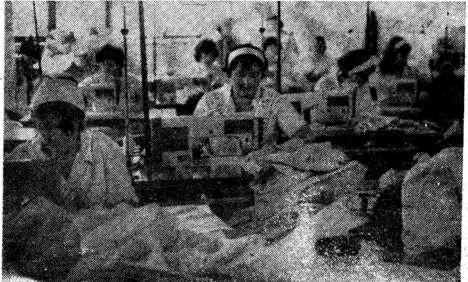
Aspect de muncă din cadrul secției nr. 1 a Întreprinderii de confecții Vulcan, unde lucrează numai confecționere cu o înaltă pregătire profesională.