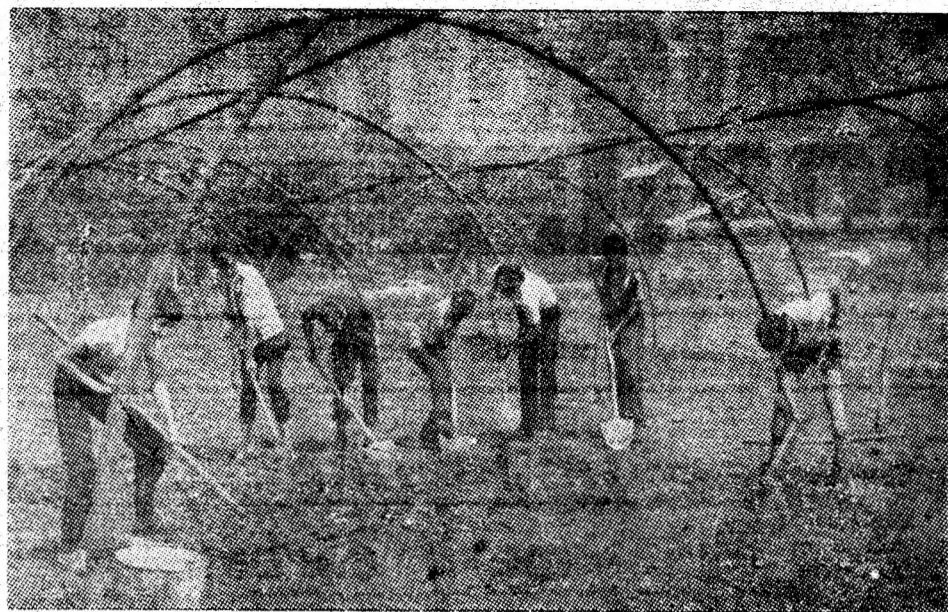
Numeroși elevi de la Liceul industrial nr. 1 din Lupeni își desfășoară, în aceste zile, activitatea de practică productivă la extinderea și amenajarea serelor din zona estică a orașului.