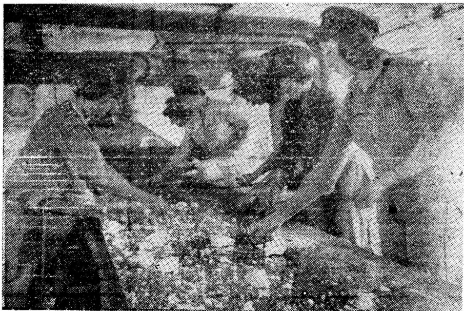
Materia primă pentru lentile optice, sticla specială din cuarț și semi-cuarț, diferite emailuri, trece prin mîinile soțiilor și fiicelor minerilor.