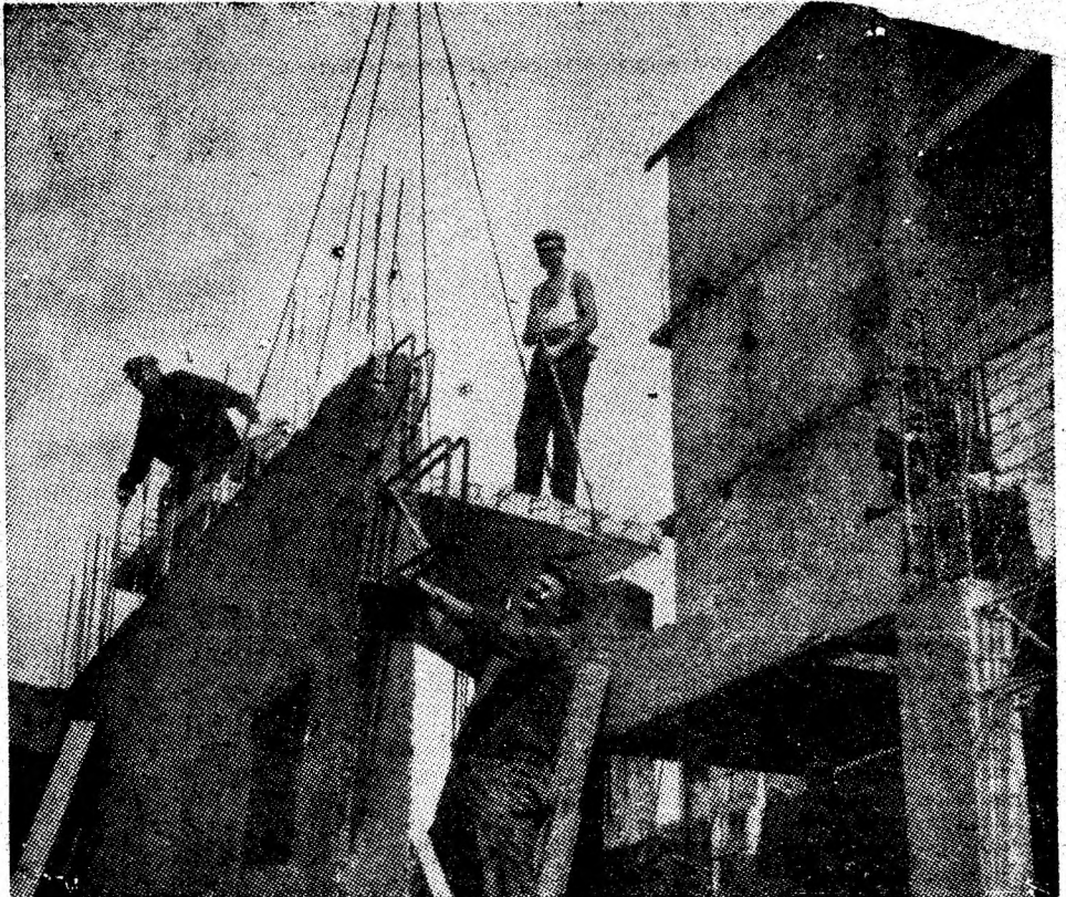
Echipa condusă de destoinicul dulgher Gheorghe Neagoie, în timp ce „împletăște” pereții viitoarelor apartamente ale blocului 59 B din cartierul Petrosani — Nord.