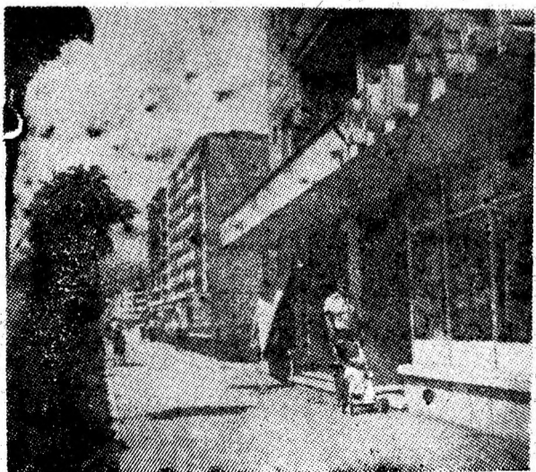
(În pagina a 3-a)