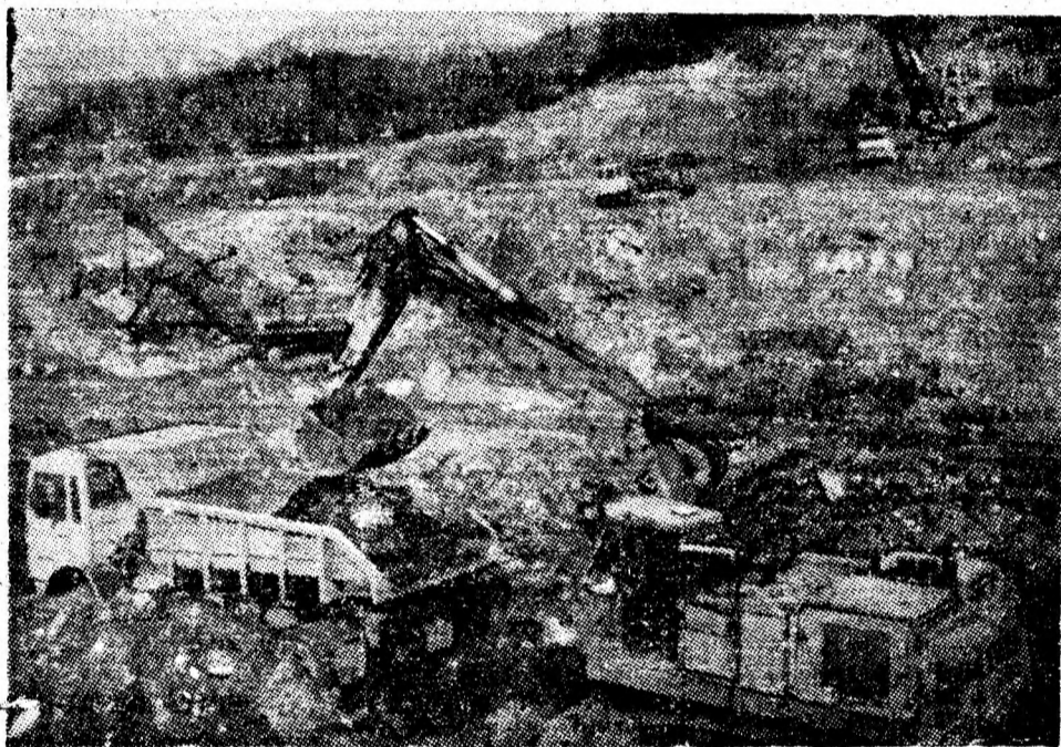
Grupul colectiv de conducători auto, buldozeriști și excavatoristi al carierei Cîmpu lui Neag, folosind eficient timpul de lucru și mașinile la randament maxim raportează, la zi, realizarea peste sarcinile de plan a peste 66 mii tone de cărbune. În imagine aspect de muncă din cadrul carierei.

ie. Peisajul din jurul cinematografului nu e cu nimic mai prejos. O baltă (care tînde să devină lac de acumulare — acumulare de pietre, de gunoaie, țînțări și altele... sticle) se întîmpină la ieșirea din stînga. Lucrătorii E.G.C.L., secția apă-canal au venit, au văzut și nimic n-au făcut. Vin ploile, iar la cinema 7 Noiembrie ploaia înăuntru și e baltă-afară. A venit toamna, tovarășii de la E.G.C.L. Aceasta nu vă spune nimic?