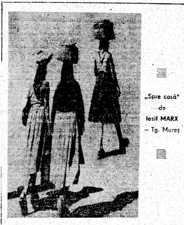
„Spre casă” de Iosif MARX — Tg. Mureș