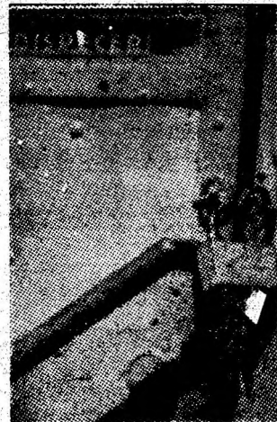
Ușa ferocată cu lacăt.