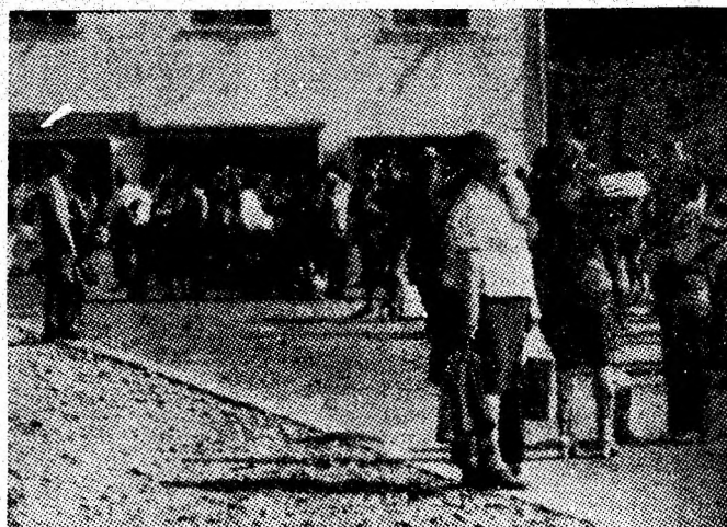
Călătorii așteaptă zadarnic plecarea vreunui autobuz pe ruta Petroșani — Uricani.

În zilele Săptămînii Crucii Roșii colectivul laboratorului și alte cadre sanitare, cu sprijinul comitetelor și comisiilor de Cruce Roșie, vor organiza în continuare acțiuni de recoltare în toate localitățile Văii Jiului.