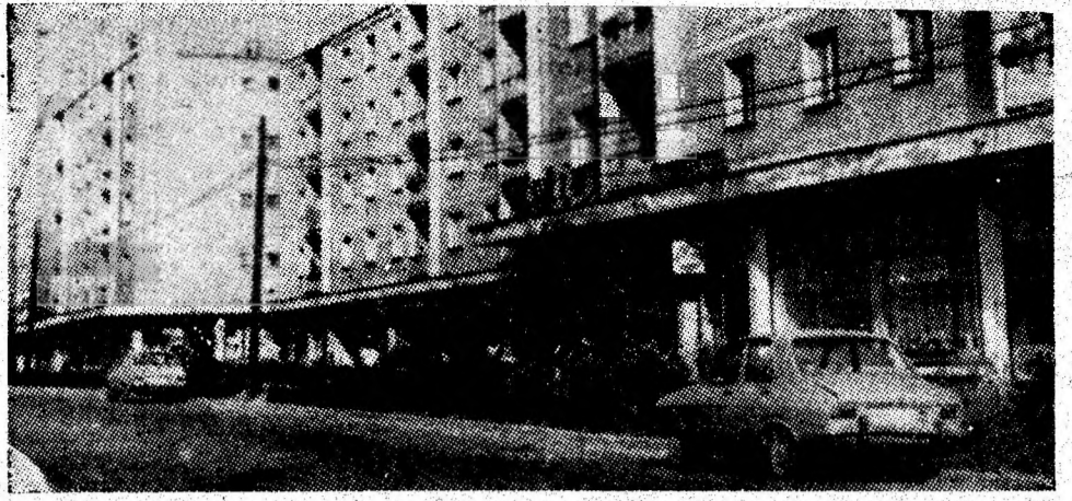
Vedere din Petrila.