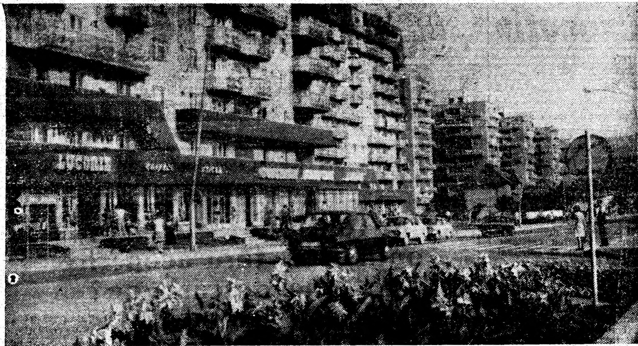
Panoramă a noului centru civic al Petrosaniului.