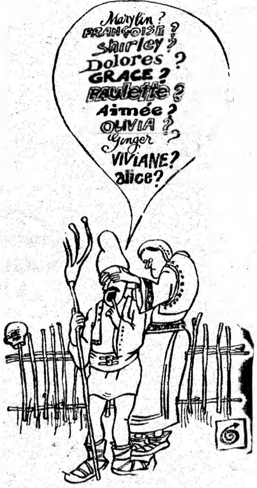
Dulcine. Femeia încă o terra ignota în virtutea unei prejudecăți sau a narcisismului ei nedeclarat? Oricum atenție: Hic sunt leones!

E ușor de înțeles că se poate întîmpla astfel, aștia vreme cît și perișorul lui Don Quijote a avut la capăt o victorie.