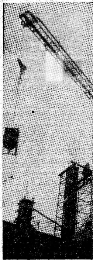
Pe șantierul de construcții a noii întreprinderi de fire celulozice tip „Viscoza“ din Lupeni, lucrările se desfășoară in ritm susținut. In imagine, aspecte de la montarea structurii de rezistență pentru unul din nivelele superioare.

mineresc de la Vulcan, care merită popularizate și încurajate, prin diverse forme de cointerese materială și morală. In acest sens, organizațiile de partid, de masă și obștești (sindicat, O.D.U.S., a femeilor) și de tineret au sarcina de a mobiliza pe toți oamenii muncii la realizarea unor rezultate superioare, care să asigure o eficiență sporită a activității productive, economisirea unor însemnate valori materiale, a fondului de timp și un grad mai ridicat de folosire a forței de muncă.