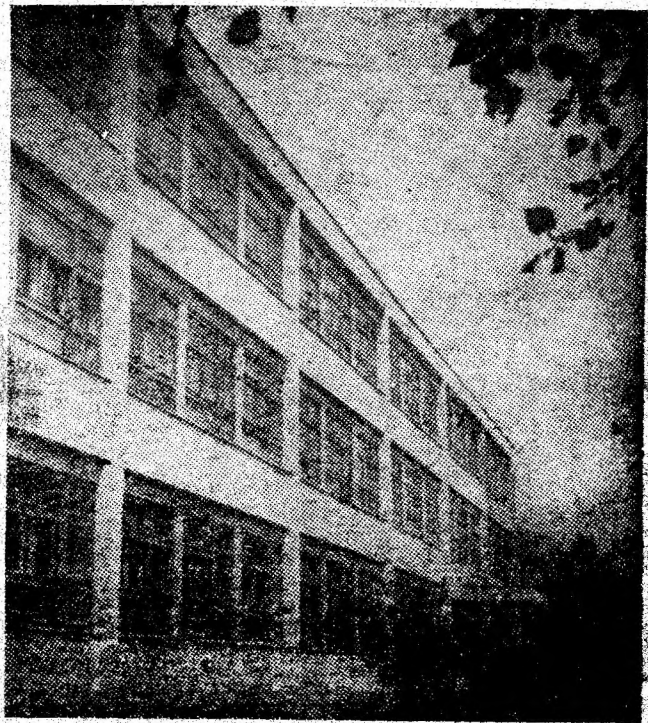
Școala generală nr. 6 Petrița, unul din modernele lăcașe de învățămînt ale acestui oraș minieresc de tradiție.