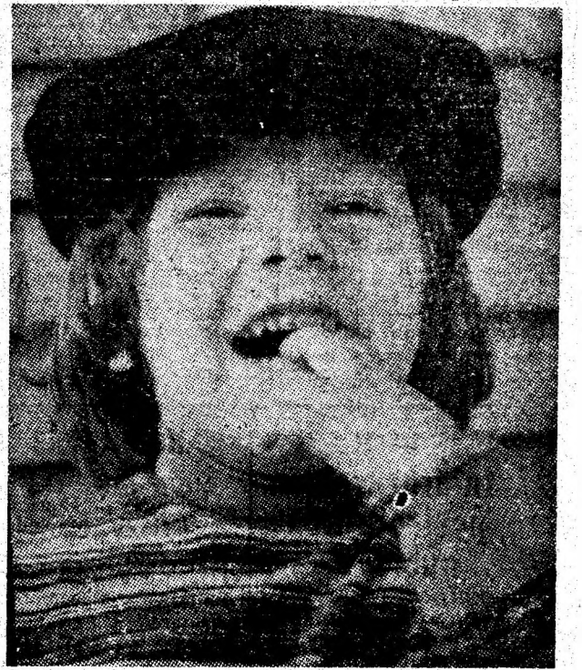
Crește, nu crește ???