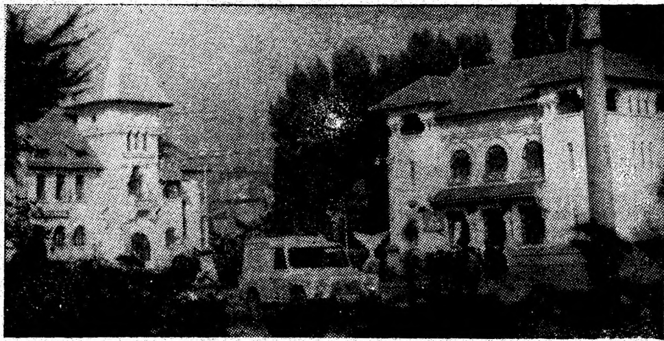
Lupeni. „Centrul vechi” al orașului.