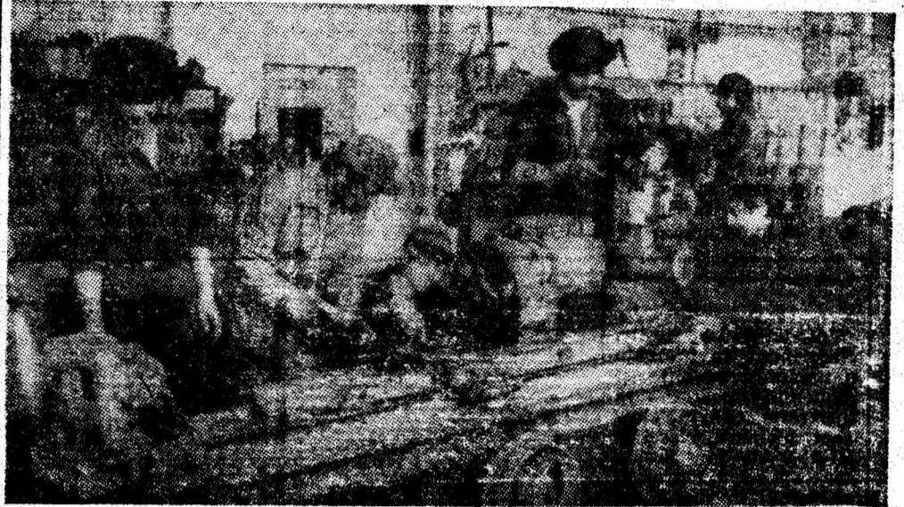
Echipa de reparații utilaj minier, condusă de Petru Șamotă, se numără printre formațiile de lucru fruntașe ale atelierului mecanic de la I. M. Dîlța.