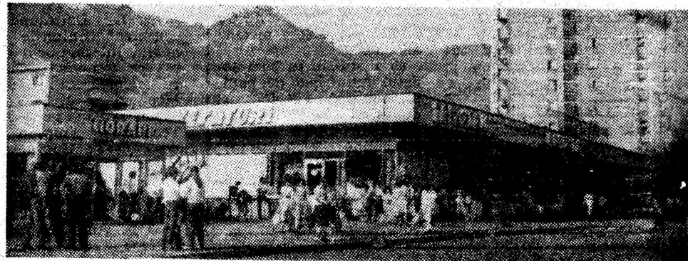
În centrul celui mai mare cartier „8 Martie”, complexul comercial cunoaște o afluență permanentă de cumpărători.

zat al statului. Se va acționa pentru mai bună folosire a terenurilor și valorificarea lor corespunzătoare pe de o parte prin dezvoltarea activității în domeniul creșterii animalelor, iar pe de altă parte, prin cultivarea unor cantități sporite de produse legumicole și porumb.