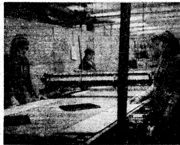
Tînărul colectiv al fabricii de mobilă se afirmă cu o participare crescîndă la întărirea economiei orașului.

E ste într-adevăr, o creștere edificatoare care pune în evidență capacitatea unei mari colectivități de a spori meritu partea sa de contribuție la dezvoltarea economică și socială a patriei.