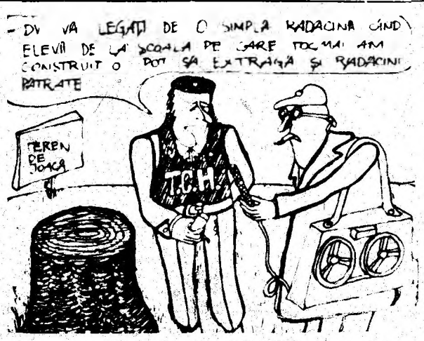
Desen de Mihai BARBU