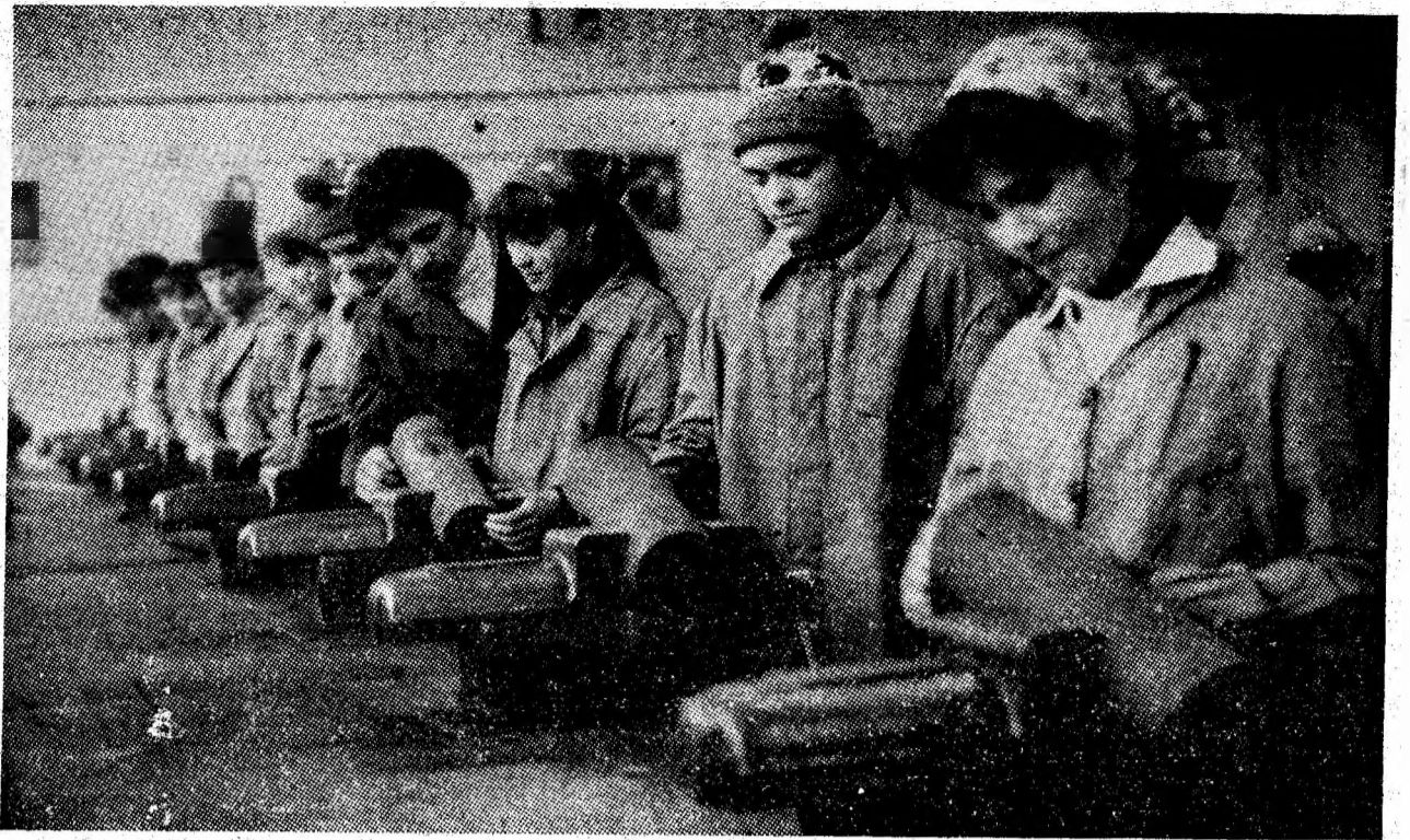
Cu atenție, cu răbdare elevii fac pași hotărâtori spre calificarea profesională.