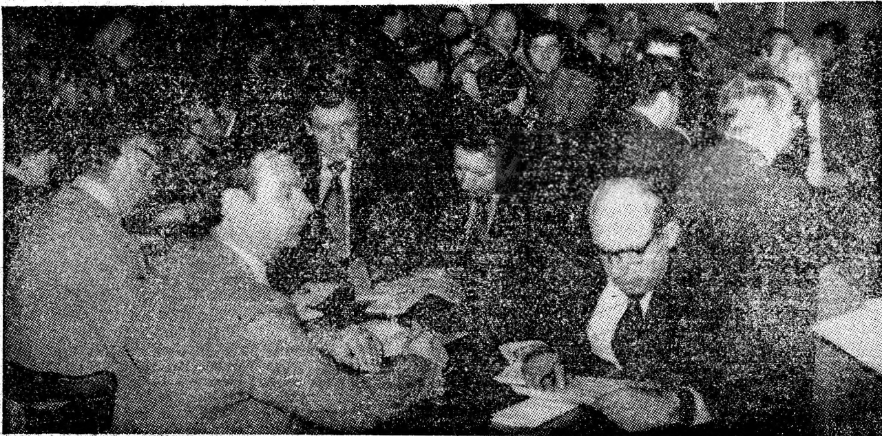
Urmărite cu interes, comunicările prezentate în cadrul consfăturii de la Petroșani au prilejuit un larg schimb de experiență pentru cadrele cu răspundere în domeniul pregătirii forței de muncă.

a centrelor Cîștigul ar dacă s-ar editarea de nualor ca cerințelor canizării și în subteran la forma tehnicierii care, specialică, electrnică și niera. De de un real rea unor mulare atît care dovedtru calificaționarea pr și a condu sului de sprijină înfesional di