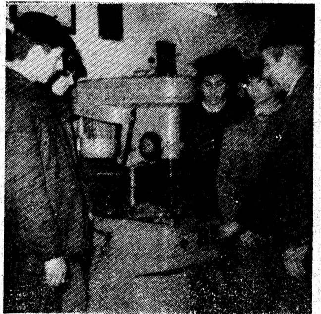
Pentru a deveni eficientă, practica productivă trebuie să se desfășoare în condițiile unei dotări tehnice corespunzătoare. Imagine din atelierul școlii al Grupului școlar minier din Petroșani.

Iată o temă de meditație pentru unii lectori care obișnuiesc să se motiveze de la cursuri, sau pentru conducătorii acestora care îi solicită prea des, tocmai în momentele cînd ar trebui să se afle la catedră, la „prevenirea viitoarelor avarii“!