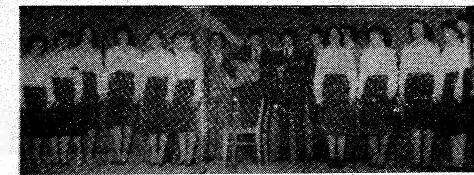
„Pentru liniștea planetei” — montaj literar-muzical realizat de artiștii amatori de la Clubul muncitoresc Aninoasa.