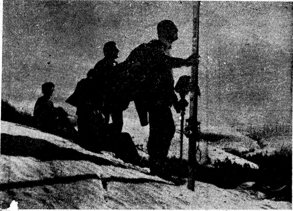
Chemarea înălțimilor alpine.