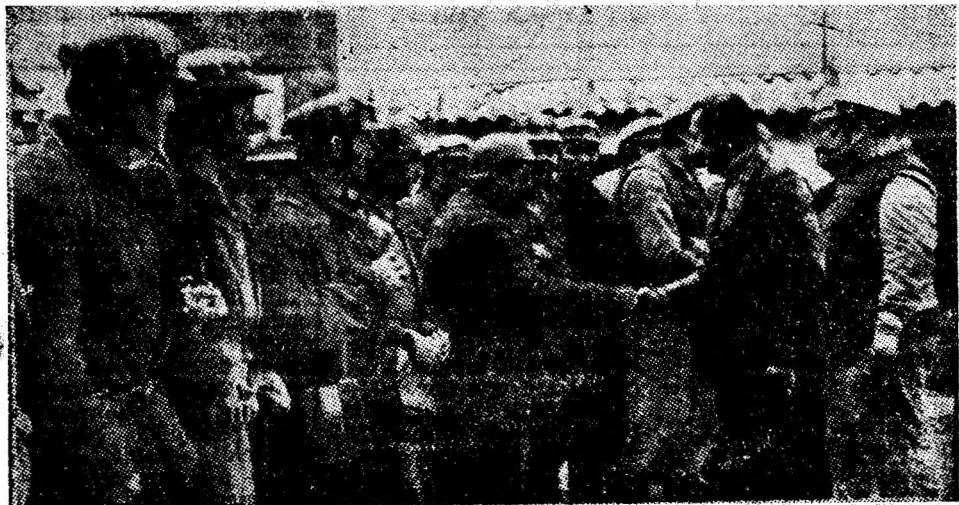
Calde felicitări adresate fruntașilor la ieșirea din șut.

sectoarelor productive ale celei mai mari mine din bazin. Încă din prima lună a acestui an, oamenii muncii de aici —