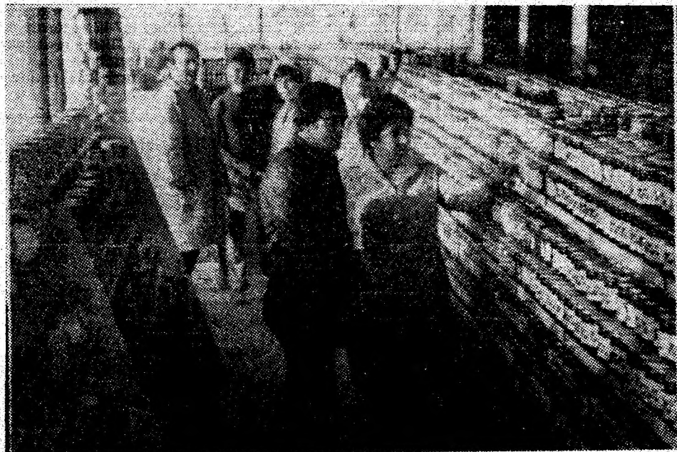
Aspect din cadrul complexului alimentar nr. 290, cea mai mare unitate de profil din Lupeni.