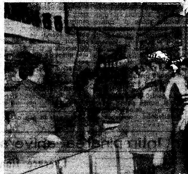
Magazinul 370 Menaj, una dintre unitățile comerciale deschise recent în noul centru civic al orașului Lupeni.