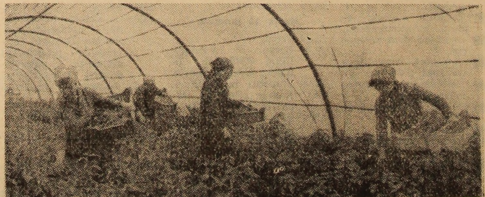
La I.A.C.C.V.J., din solarile de la Lupeni, se culege a doua recoltă de ardei.