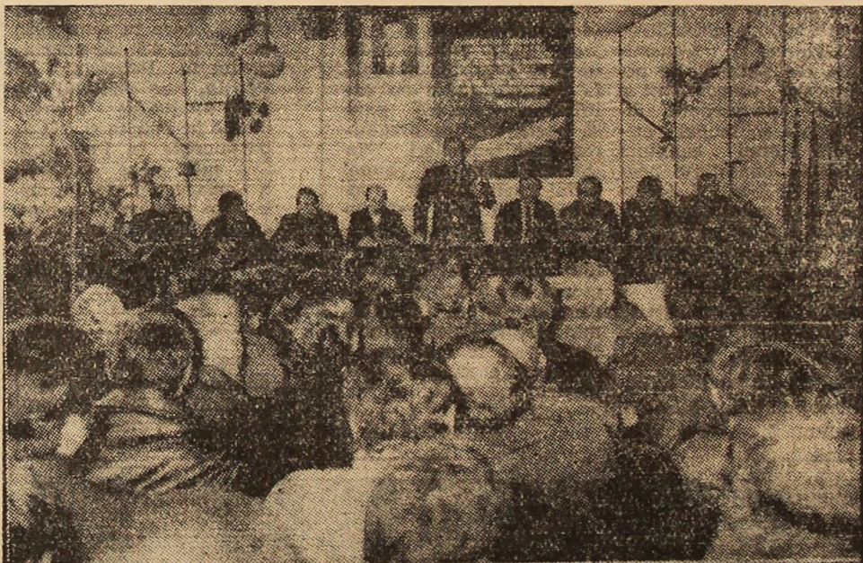
Aspect din timpul desfășurării adunării reprezentanților oamenilor muncii de la I.M. Uricani.