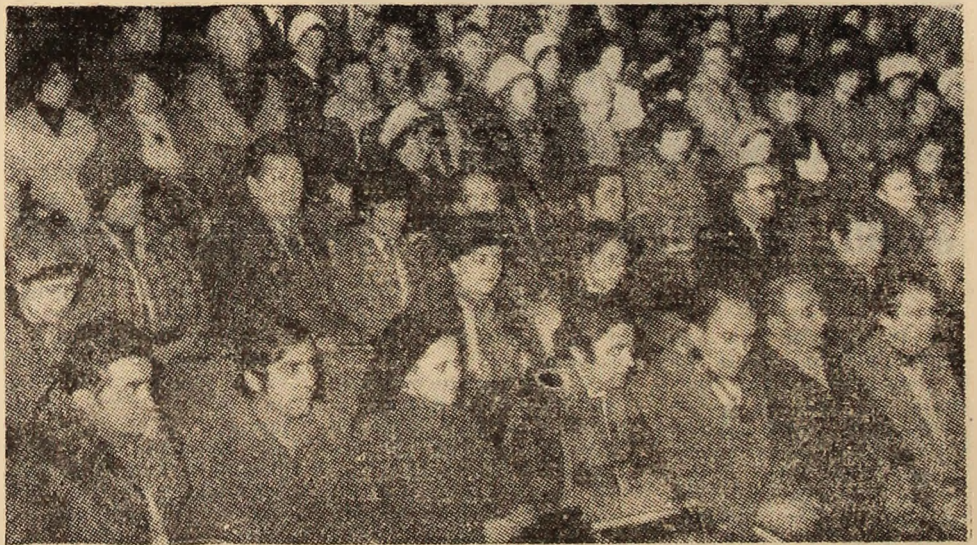
Aspect din desfășurarea adunării cetățenești de la Petroșani.

Supusă votului deschis al adunării cetățenești, propunerea de candidatură pentru circumscripția electorală nr. 6 Petroșani în Marea Adunare Națională a fost aprobată în unanimitate.